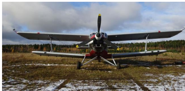
Рисунок 1 Аэромагнитная градиентометрическая система, смонтированная на самолете Ан-3.

Стоит отметить, что на данном участке курс рядовых маршрутов устанавливался заказчиком и, с нашей точки зрения, не являлся оптимальным. Связано это с тем, что в структуре магнитного поля ряд интенсивных линейных аномалий по простиранию совпадали с направлением полета. На завершающем этапе произведена интерполяция магнитного поля на регулярную сеть на основе метода минимальной кривизны. Первая с использованием только маршрутных данных и вторая с использованием данных поперечного градиента (Рис.2). При сравнении двух полей видно их различие на участках линейных аномалий, при этом в спокойных полях такой разницы не наблюдается. На карте полного вектора магнитной индукции, построенной с привлечением алгоритмов градиентометрии морфология параллельной маршрутам линейной аномалии, принимает более законченный и объективный вид. Следует отметить то, что для стоящих геологических задач, с целью решения которых выполнялась аэромагнитная съемка на этом участке, именно эти аномалии представляли поисковый интерес. Качественно можно судить о существенном повышении детальности съемки, особенно это касается градиентных участков поля.